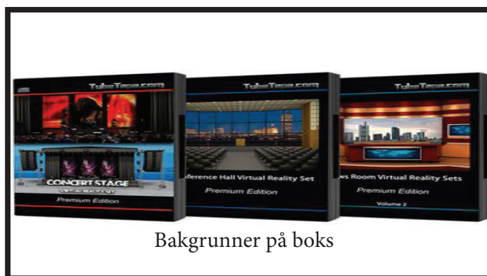
Bakgrunner på boks

Bakgrunner på boks. Sett opp en greenscreen og velg hva slags bakgrunn du ønsker. I disse tre boksene kan du finne det meste. Sett deg selv inn i et studio el.